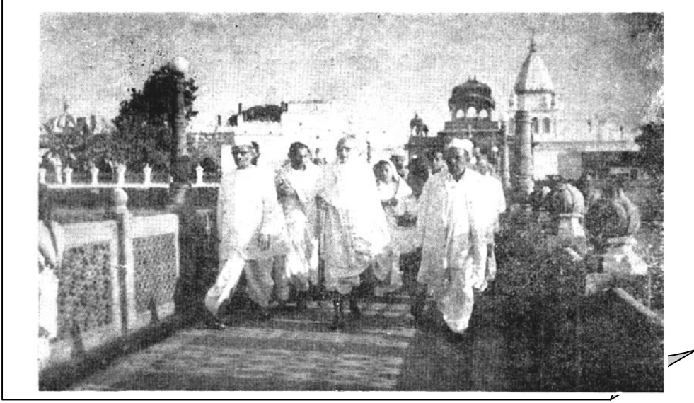
પાવાપુરી સિદ્ધિધામમાં જલમંદિરની યાત્રા કરીને પૂ. ગુરુદેવ પધારી રહ્યા છે.