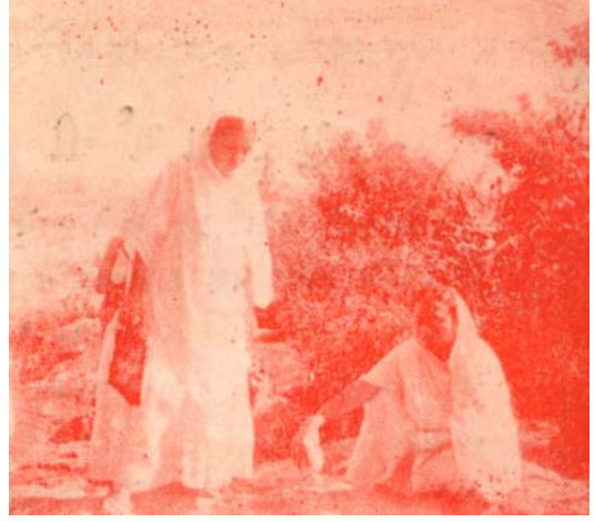
(૨) પોન્નૂરના પહાડ પર