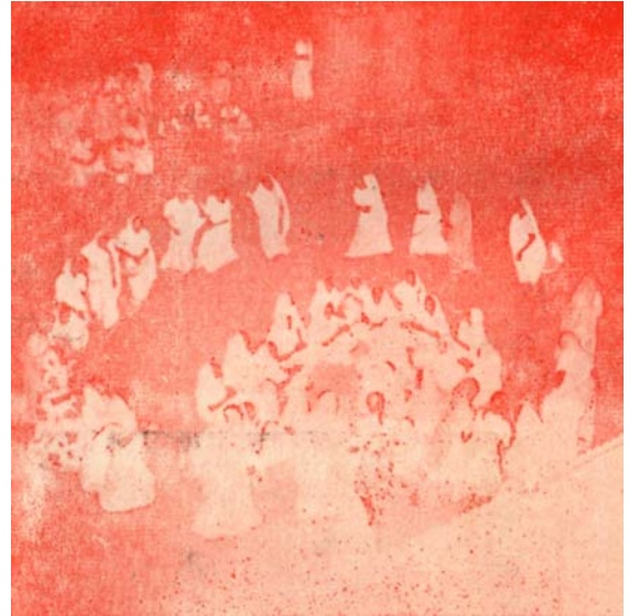
(૪) કુંથલગિરિસિદ્ધિધામની યાત્રાનો ઉલ્લાસ

પૂ. ગુરુદેવ સાથેની તીર્થયાત્રાપ્રસંગનાં આ ચાર ચિત્રોના પરિચય માટે સામે પાને જુઓ.