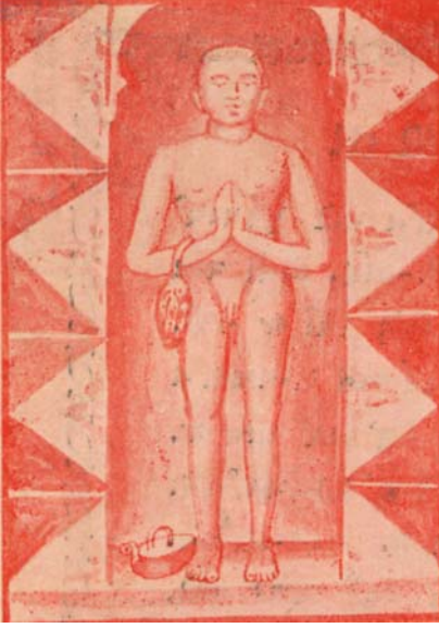
(૧) બડવાની ચૂલગિરિ પર્વત પર