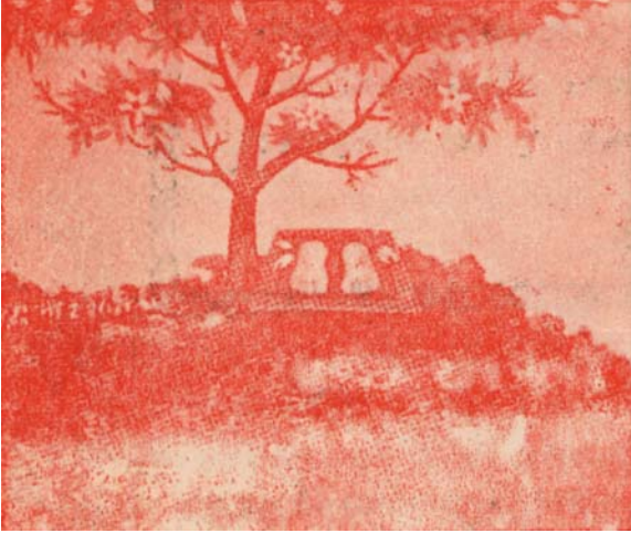
(૩) પોન્નૂર તીર્થમાં પવિત્ર પગલાં